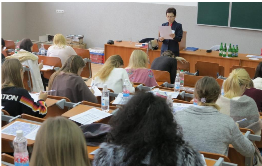
XIV edycja Konkursu Ortograficznego z Języka Polskiego dla Młodzieży Akademickiej Ukrainy (24 XI 2018)