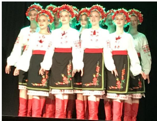
VIII Festiwal Nauki i Kultury Europejskiej (15 V 2019). Zespoły artystyczne z Narodowego Uniwersytetu Sadownictwa w Humaniu