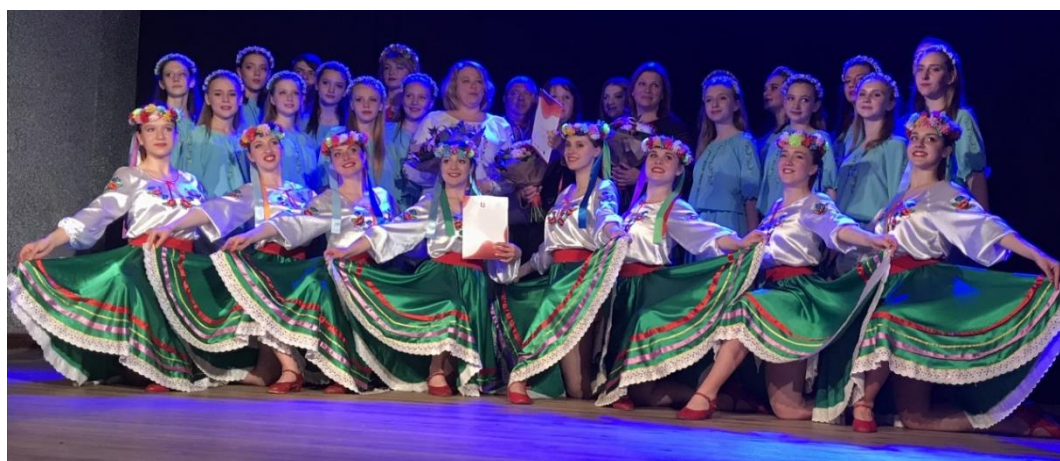
VIII Festiwal Nauki i Kultury Europejskiej (15 V 2019). Zespoły artystyczne z Narodowego Uniwersytetu Sadownictwa w Humaniu